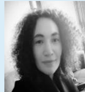
Dinah Arts Bestuursvoorzitter